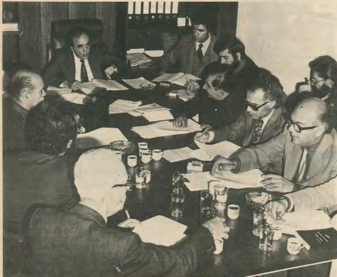
Ὁ Πρόεδρος τῆς ΕΔΕΚ Δρ. Βάσος Λυσαρίδης ἀναλύει τὸ κοινὸ πρόγραμμα τοῦ κόμματος στοὺς δημοσιογράφους.